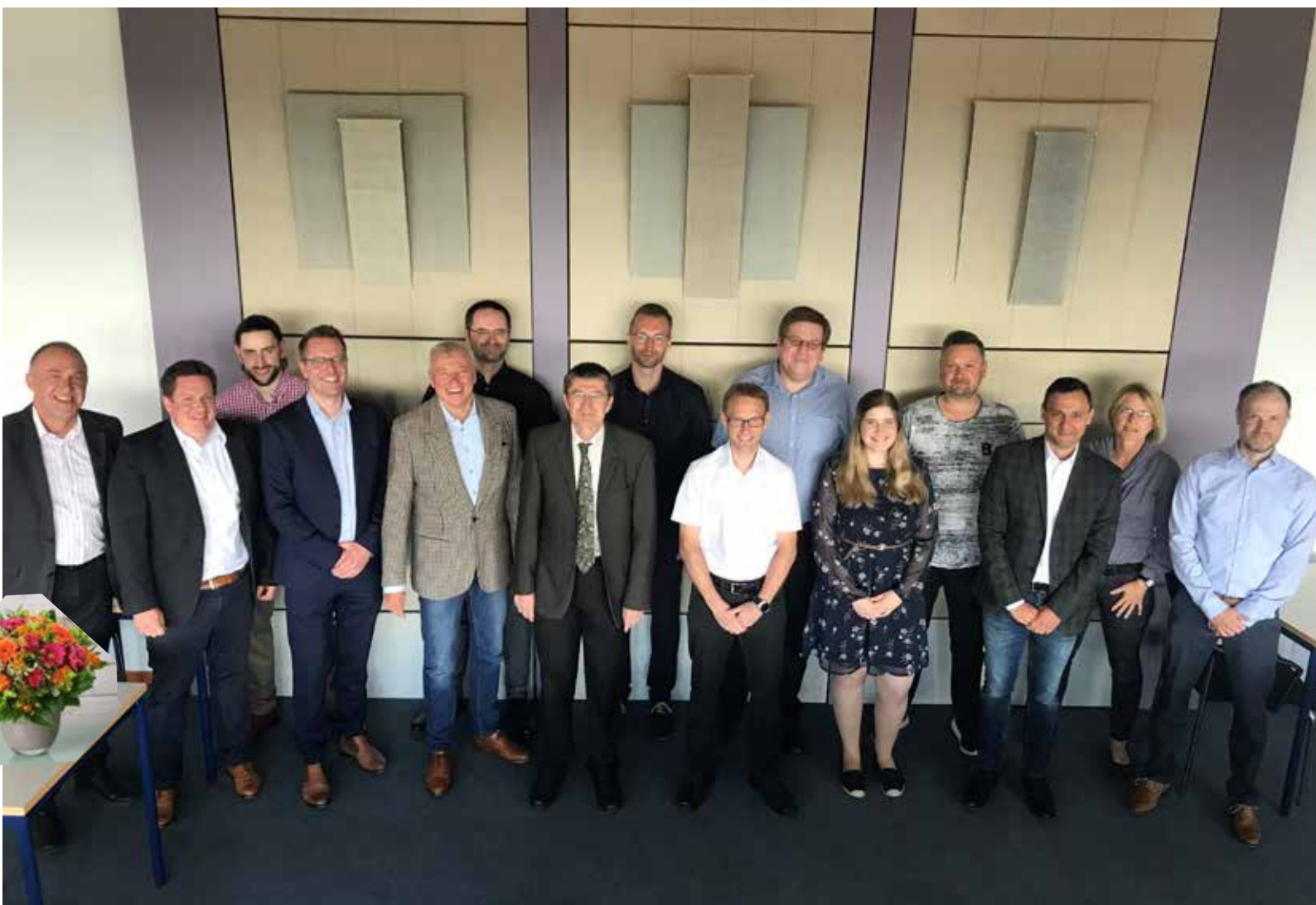
Gruppenfoto mit Präsident, Foto: Thomas Michalik

Hochschule für den öffentlichen Dienst in Bayern Fachbereich Allgemeine Innere Verwaltung in Hof